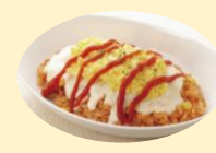
ふわふわオムライス