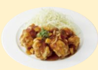
チキン唐揚げ 秋の野菜あんかけ