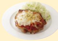
ピザ風グリルチキン