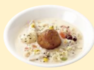
北海道クリームチー