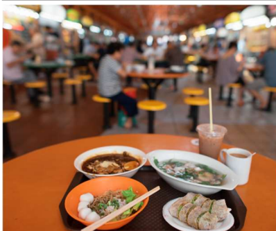
ホーカー (屋台街) とローカルフード