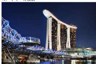
マリナーベイ夜景