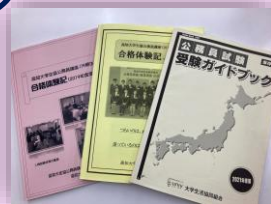
合格体験記と受験ガイドブック