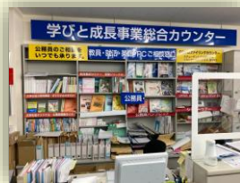
朝倉ショップ内講座カウンター