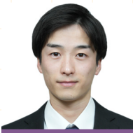
広島地方裁判所 (裁判所職員一般職) 採用

その情報網だけでなく、サポートルームの職員の方々の手厚いサポートも他にない魅力です。長い公務員試験でのモチベーション維持や、複雑な公務員試験のスケジュール管理において、この心強いサポートなしには語れません。みなさんがわたしたちに続き本講座で合格を勝ち取ってくださればいちOGとして幸いです。応援しております!