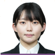
岡山労働局 (労働基準監督官A) 採用

公務員試験を受けようと考えている方は、ぜひ実績がある本講座の受講を考えてみてください。皆様が納得のいく進路を掴み取ることを心から願っています。