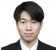
広島県庁 (行政職) 採用

私は、公務員講座のおかげで、長年の夢を叶えることができました。自分のやりたいことを実現するための一歩として、公務員講座の受講を検討してみてください。応援しています。