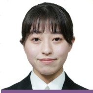
内閣府 (国家一般職) 採用

試験対策は、内容が多く、心が折れてしまいそうなこともあると思いますが、公務員講座のサポートをフルに活用することで、合格に大きく近づけると 생각합니다。公務員講座の卒業生と一緒に働けることを楽しみにしています。