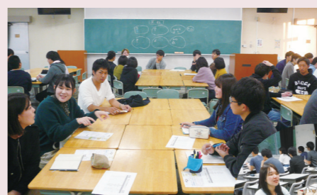
合格した先輩との交流会

合格した先輩が、皆さんのサポーターとして、自らの経験に基づいて合格に向けた手助けをします。実際に公務員となったOBやOGも、様々な場面でサポートします。また『交流会』の実施や『合格/受験体験記』の配布など、受講生特典もいっぱいあります。