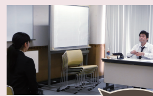
本番さながらの講師による面接指導